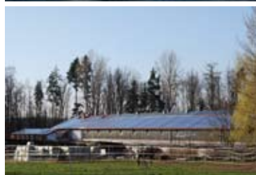
Ausgewählte Referenzanlagen der PT Erneuerbaren Energien